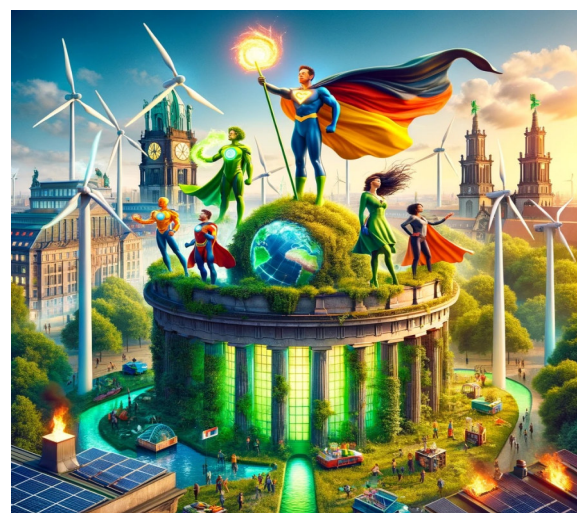
Titel: Superhelden und Nachhaltigkeit

Hinweis: Investiert wird marktgewichtet in die fantastischen Fünf (SAP, Siemens, Allianz, Münchener Rück, Deutsche Telekom). Der Aktienkorb wird jährlich entsprechend der Marktkapitalisierung der Unternehmen angepasst. Wertentwicklung = Brutto-Performance in Euro Quellen: Factset, Metzler; Zeitraum: 28.02.2014 bis 29.02.2024